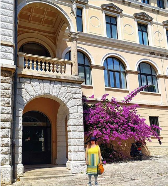
A képzés helyszíne